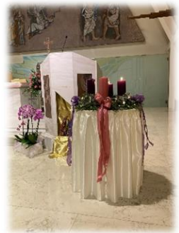
La chiesa nel tempo di Avvento